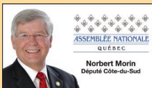
Norbert Morin Député Côte-du-Sud