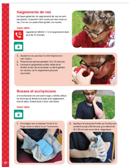
Exemples de pages